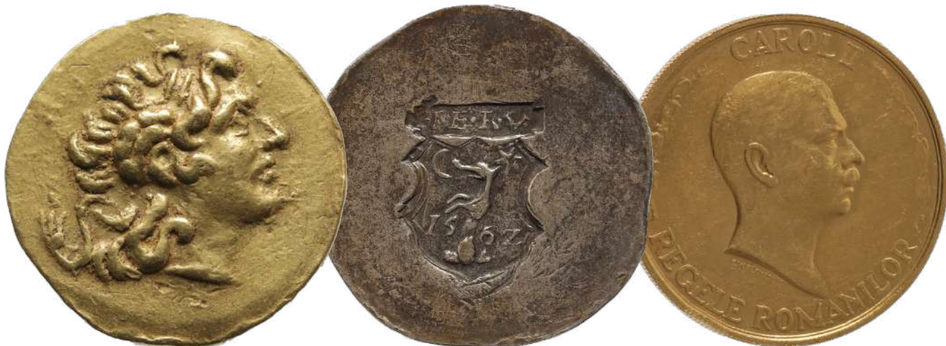
Monedă Stater, Mithridates VI Eupator Adjudecat: €4.750

Piața de artă nu începe și se termină cu artele frumoase , ci continuă și se adâncește cu profunzimea spirituale ale identității naționale, pe care le explorează, cartează și pune în valoare prin evenimente dedicate, precum licitațiile de carte și hartă veche, cele de Regalitate ori cele de medalistică și numismatică. Prima jumătate a anului 2024 aduce și recordul de vânzare publică la monedă, prin cel mai bine adjudecată monedă interbelică – moneda din aur de 100 de lei 1940 , adjudecată pentru 32 de mii de euro – precum și cel mai bine adjudecată monedă transilvăneană – talerul de necesitate din argint, bătut în 1562 de Ioan Sigismund Zapolya, adjudecat pentru 4.500 de euro. Totodată, un stater din aur, bătut de Mithridates VI Eupator, regele Pontului, pentru Lysimachos al Traciei, în 88-86 î.e.n., s-a adjudecat pentru 4.750 de euro. Remarcăm și fotografia istorică ilustrându-l pe Avram Iancu, la 1865, adjudecată pentru 5.000 de euro – toate acestea în data de 26 martie 2024.