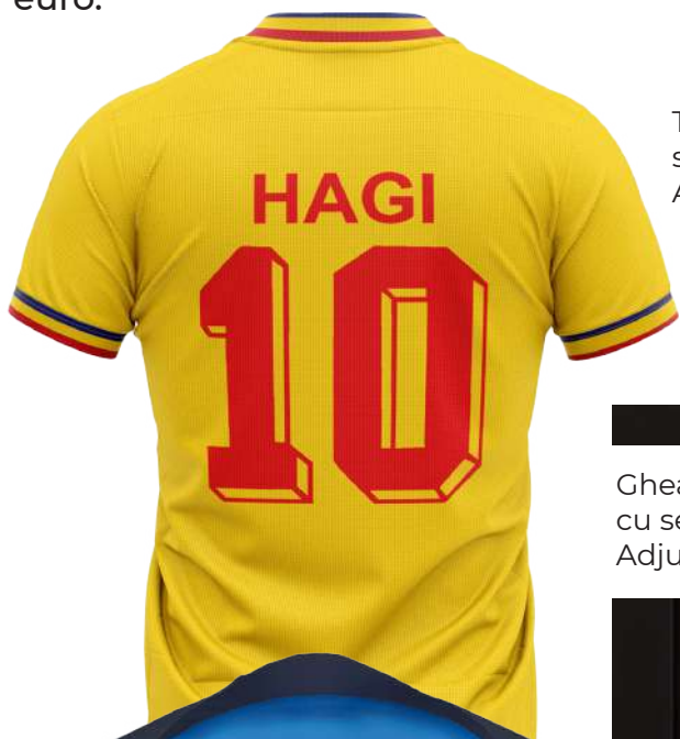
Tricoul de joc al lui Gheorghe Hagi (10), semnat autograf Adjudecat: €30.000

Reprezentată deja prin 3 evenimente în prima jumătate a lui 2024, impresionează de la primele licitații, marcând două recorduri absolute (prin raportare la adjudecările ocazionale realizate în varii licitații trecute, cu tematici mai generale): cel mai bine adjudecat într-o licitație publică tricou de joc al unui fotbalist român – Gheorghe Hagi – semnat autograf, folosit în meciul „Generației de Aur” din 24 mai 2024 – 30.000 de euro; de asemenea, tricoul de joc al lui Rivaldo , semnat autograf, folosit într-același meci – 20.000 de euro, contând drept cel mai bine adjudecat tricou de joc aparținând unui fotbalist străin! De menționat și gheata de fotbal Adidas, purtând semnătura lui Lionel Messi, adjudecată în data de 31 mai 2024 pentru 3.250 de euro, precum și lotul format dintr-o rachetă de tenis Adidas și o minge de tenis Roland Gaross, semnate de Ilie Năstase în 2012, adjudecat, în aceeași licitație, pentru 1.200 de euro.