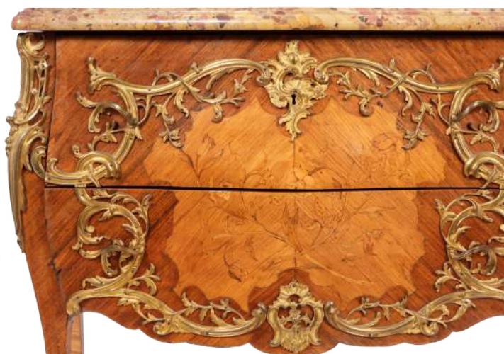
Comodă "en tombeau" în manieră Rococo Adjudecat: €5.000

Decorative art is not dead! Dimpotrivă, mobilierul de autor, atât cel din secolele stilurilor elaborat decorative, cât și cel din perioada liniilor simplificate ale Art Deco-ului ori Mid Century Modern-ului au beneficiat de o piață solidă în prima jumătate a lui 2024 . Zonă de obicei rezervată unei nișe de public, având un gust educat, ba chiar erudit, a performat în privința unor piese speciale, ajunse în licitațiile de profil din februarie și aprilie 2024. Exemplificăm cu doar câteva piese: comoda Rococo „en tombeau”, decorată cu vrejuri din bronz aurit, realizată de Pierre Bernard în a doua jumătate a sec. al XVIII-lea, adjudecată (în data de 22 februarie 2024) pentru 5.000 de euro; masa de salon Napoleon III, decorată în manieră Boulle, cu scenă mitologică, de la sfârșit de sec. al XIX-lea, adjudecată (în aceeași licitație) pentru 5.000 de euro, ori corn din fildeș congolez, așezat pe suport Louis XV din bronz aurit, datând aprox. din 1900, adjudecat (în data de 11 aprilie 2024) pentru 3.250 de euro. Remarcăm și magistrala pereche de legumiere din argint, bogat decorată cu pești și fazani, adjudecată (tot în evenimentul din aprilie) cu 3.500 de euro, ori excepționala