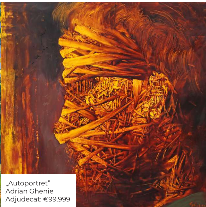
„Autoportret” Adrian Ghenie Adjudecat: €99.999