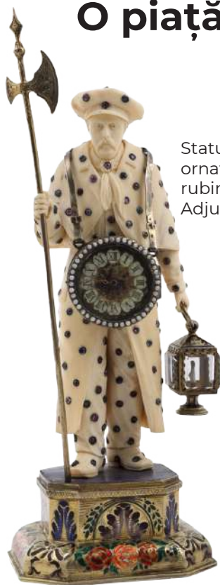
Statuete din fildeș, ornate cu safire, rubine, smaralde Adjudecat: €11.000