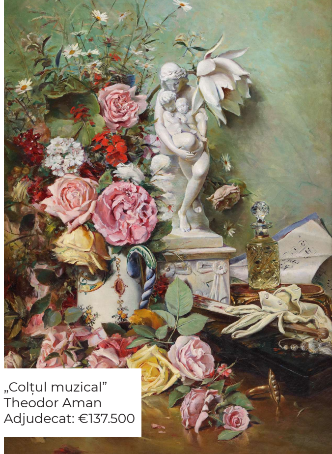
„Colțul muzical” Theodor Aman Adjudecat: €137.500

la prețului de adjudecare de 80 de mii de euro. Câtă vreme licitarea capodoperei lui Theodor Aman, realizată în 1882, „Colțul muzical”, soldată cu prețului de adjudecare de 137.500 euro, a depășit jumătate de oră, participanții, colecționari cu experiență, plusând riscant, în ultima secundă , pași mici de licitație, strategici. „Colțul muzical” al lui Theodor Aman, adjudecat pentru 137.500 de euro, reprezintă și cel mai bine adjudecată pictură a primei jumătăți a lui 2024. Aceasta a fost urmată, într-un top 5, de: Adrian Ghenie – „Autoportret” – 100.000 de euro (Licităția Artmark de Artă Contemporană, 20 februarie 2024); Ștefan Luchian – „Primăvară” – 95.000 de euro (Licităția Artmark de Vară, 18 iunie 2024); Nicolae Tonitza – „Nud în fotoliu roșu” – 90.000 de euro (Licităția Artmark de Primăvară, 21 martie 2024); Nicolae Tonitza – „Fată în interior” – 80.000 de euro (Licităția Artmark de Vară, 18 iunie 2024).